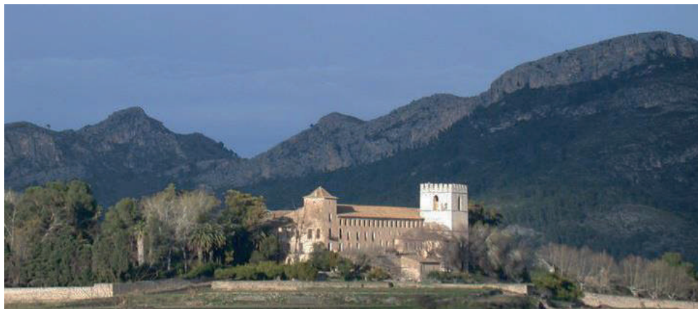
Alfauir, la Safor. Monestir de Sant Jeroni de Cotalba